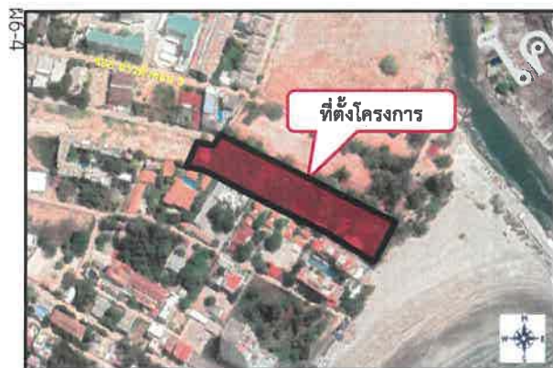
ที่ตั้งโครงการ

หากท่านต้องการข้อมูลเพิ่มเติม มีความคิดเห็น หรือข้อเสนอแนะ สามารถติดต่อสอบถามได้ที่