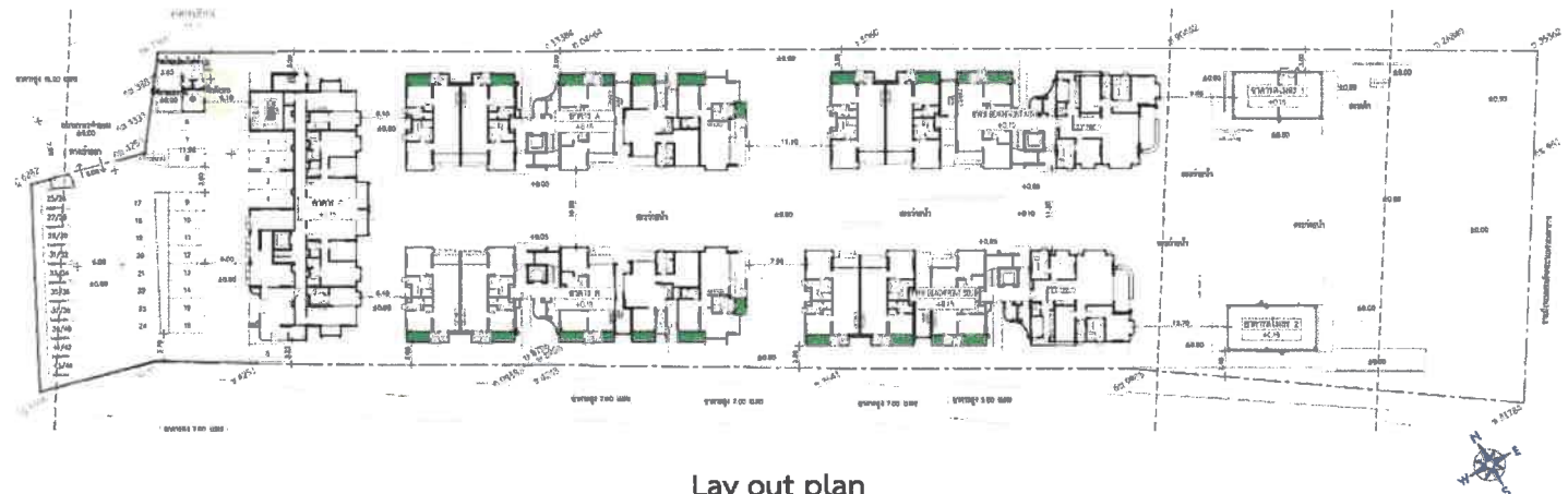
Lay out plan